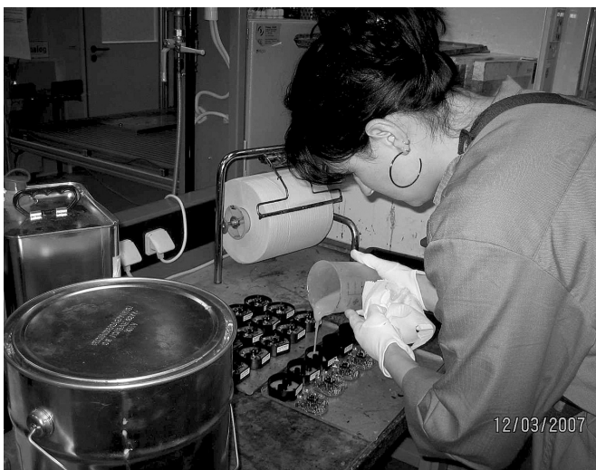
Bild 2. Vergießen elektronischer Bauteile von Hand.

Lässt sich durch Substitution oder Verfahrensänderung die Tätigkeit mit Hydrophthalsäureanhydriden nicht vermei-